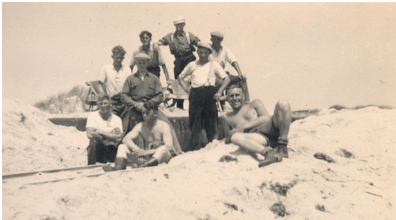
Bouwen van bunkers in de duinen van Vlieland.

Begin 2016 organiseren wij een vrijwilligersbijeenkomst waarin meer informatie over het project wordt gegeven en om verder afspraken te maken over het vrijwilligerswerk.