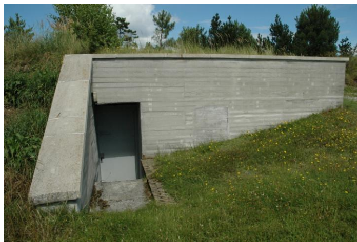
Bunker van de Luftwaffe Stelle Eisvogel op het vuurtorenduin, links een opname uit de jaren '50, rechts de zelfde bunker anno nu.

Op Vlieland zijn nog een aantal andere bunkers overgebleven uit de tweede wereldoorlog. In onze volgende nieuwsbrief gaan we daar aandacht aan besteden.