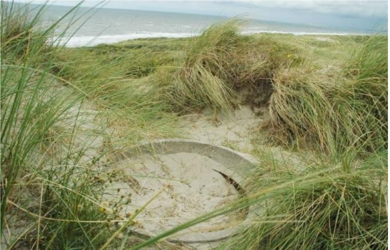
De Tobruk bij stelling 12H

Hoe de Tobruk van Stelling 12H er nu precies uit ziet, weten we nog niet. Momenteel is alleen de ring aan de bovenzijde zichtbaar, wat er onder de grond zit is ons niet bekend. Het lijkt er op dat het een type is voor een MG-34 of MG-42 machinegeweer. Als de Tobruk is leeg gegraven dan kunnen we dit met zekerheid zeggen.