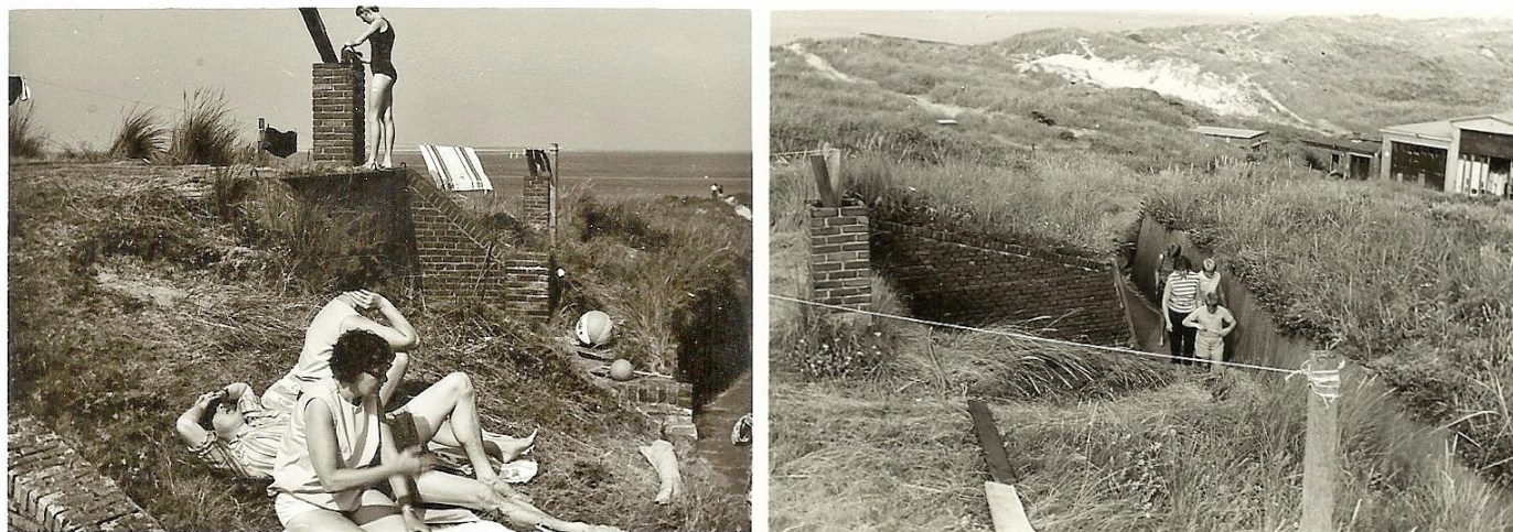
Vakantiefoto's uit de jaren 50, de bunkers bij de Oostbatterij waren in die jaren als vakantiehuisjes in gebruik

Het zijn kiekjes, destijds gemaakt om de mensen op de foto te zetten, op de achtergrond zien we echter de woonbunkers van de Oost-Batterij, en daarmee werden dit bijzondere en voor ons zeer waardevolle afbeeldingen.