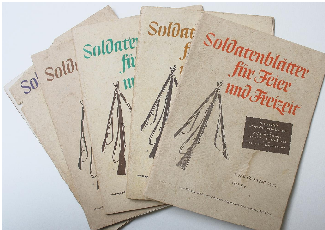
Soldatenblätter für Feier und Freizeit

Tevens kregen we van Michael Horn vijf stuks Soldatenblätter für Feier und Freizeit in 1943 uitgegeven door het Oberkommando der Wehrmacht in langdurige bruikleen. Deze tijdschriften werden destijds aan de soldaten voor ‘vermaak en vrije tijd’ uitgereikt.